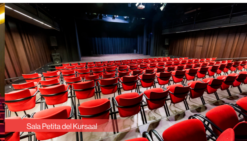
Sala Petita del Kursaal