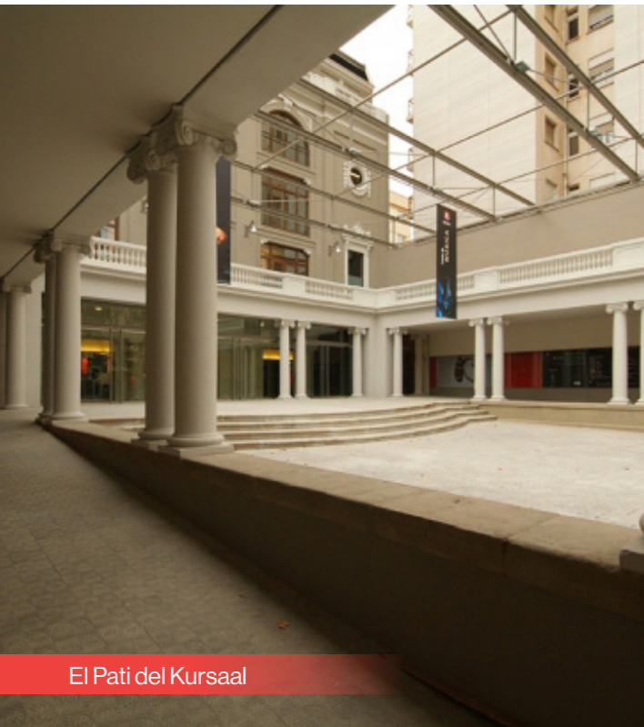
El Pati del Kursaal