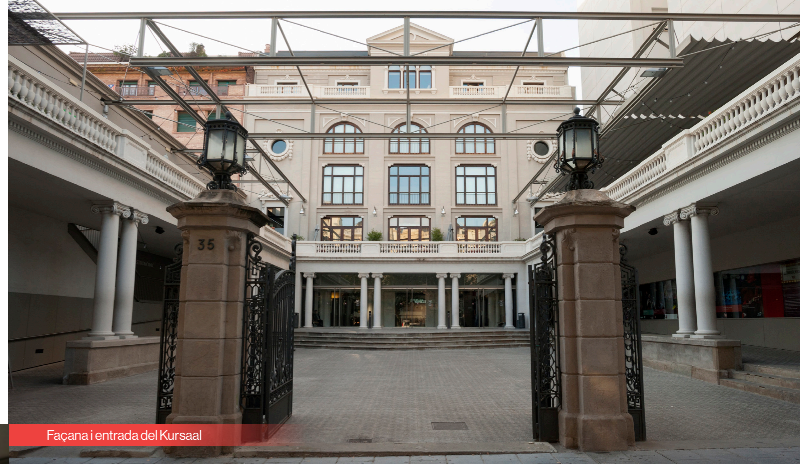
Façana i entrada del Kursaal

Espai càtering - Kursaal Espai Gastronòmic , zona de cafè, restaurant, esmorzars.