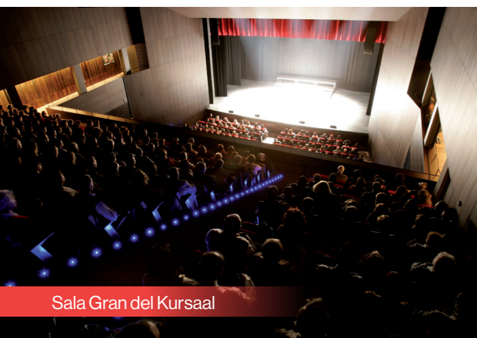
Sala Gran del Kursaal

Nom de la persona que gaudirà de l'aparcament gratuït durant els 2 dies de l'esdeveniment.